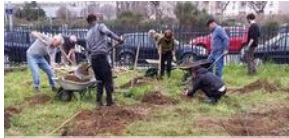
Plantation des Rosiers de Damas