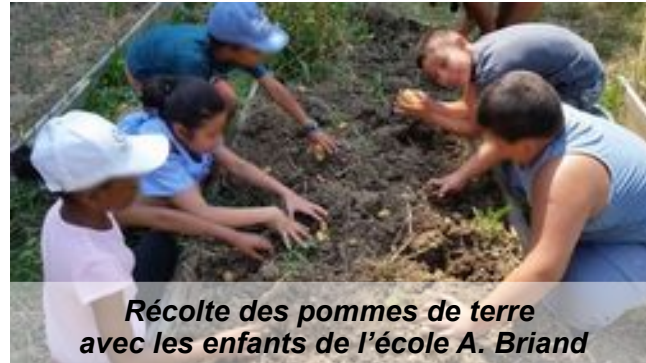
Récolte des pommes de terre avec les enfants de l'école A. Briand