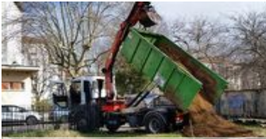
Apport nouvelle terre

Plantation de Rosiers de Damas et transformation des pétales de rose