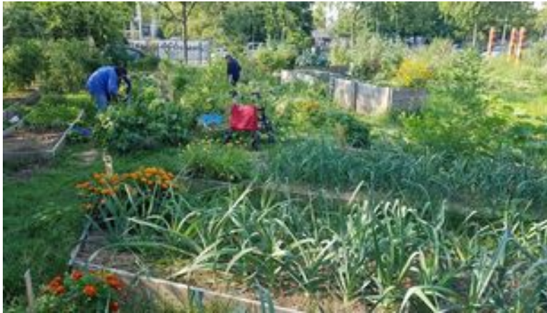
Un potager cultivé par les habitants, enfants et adultes