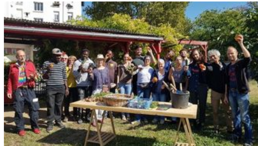
Une équipe d'habitants-jardiniers renforcée par des nouveaux partenariats solidaires