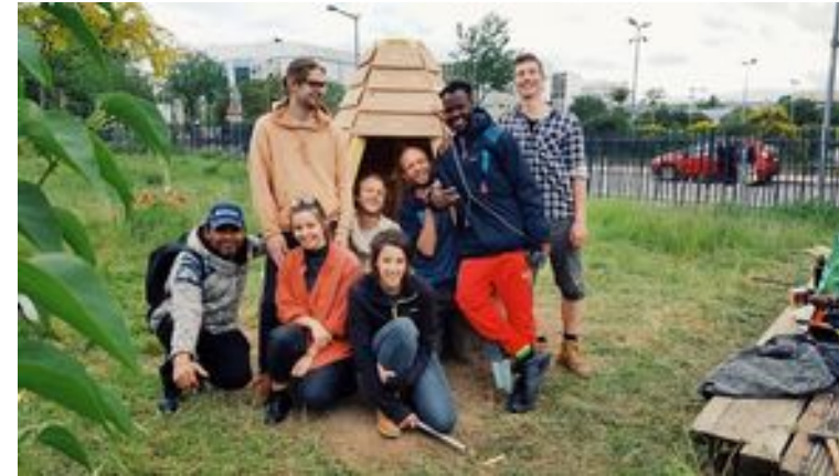
De nouveaux aménagements