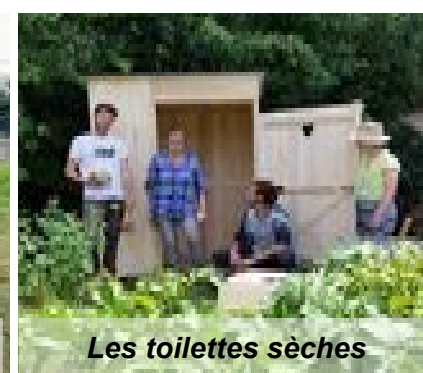
Les toilettes sèches

2019 a été l'année de poursuite de construction ou d'installation pour l'amélioration des activités de l'Oasis de Gerland