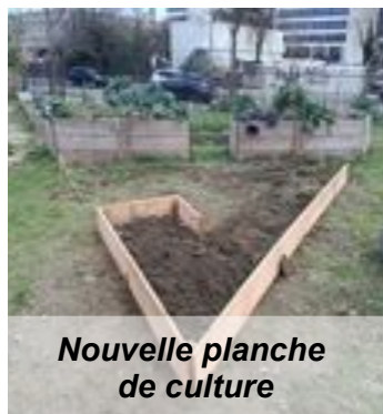
Nouvelle planche de culture