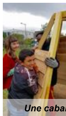
Une cabane-tipi pour les enfants