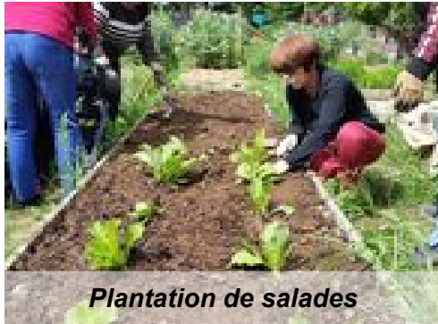
Plantation de salades