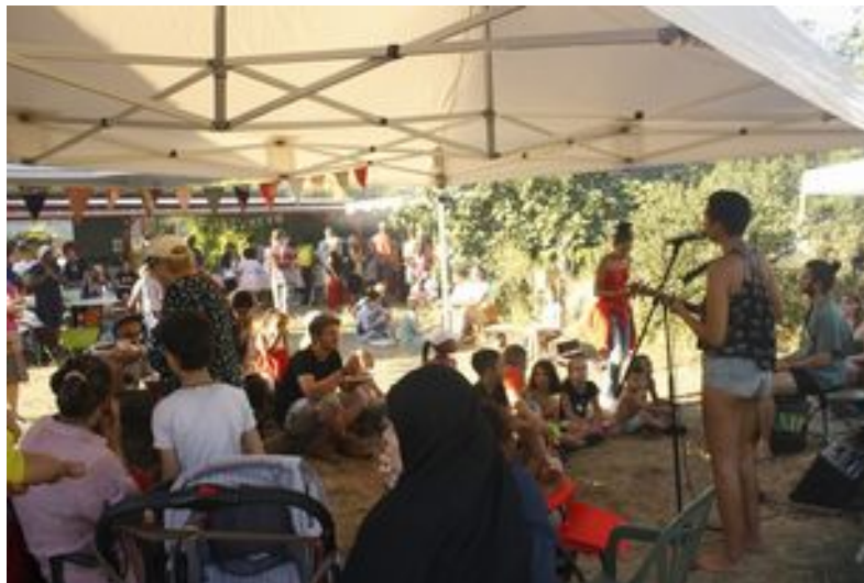
Des événements festifs à l'Oasis