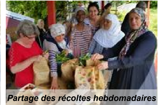
Partage des récoltes hebdomadaires

Inspirée par l'agroécologie et la permaculture, l'aventure de la réappropriation collective des connaissances et des pratiques de cultures écologiques se poursuit (fertilisation du sol, compostage, paillage, arrosage....)